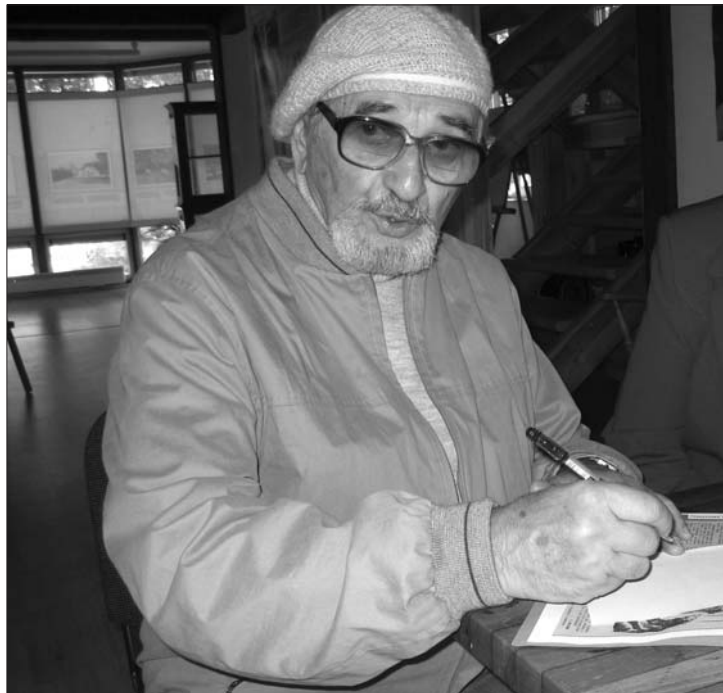
Hercs Franks 2007. gada septembrī Zooloģiskajā dārzā. Jaunā žurnālista H. Franka detalizētais pērtiķu ēdienkartes apraksts 1955. gadā avīzes redaktoram nepatika – veikalos trūka pat visparastākās pārtikas. Kāpēc kaitināt lasītāju?